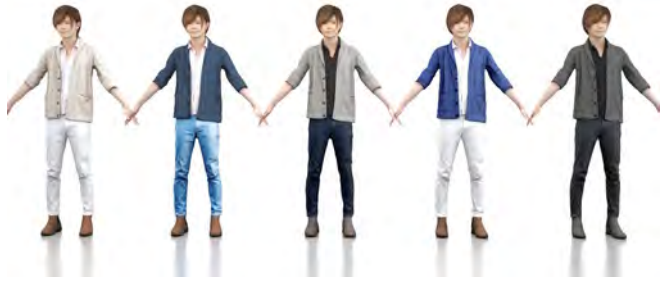
3D People A-pose02